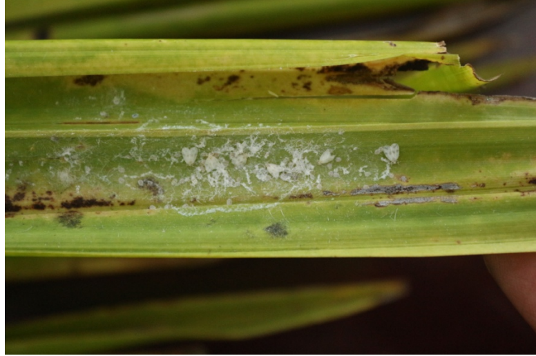
ಚಿತ್ರ 3: ರುಗೋಸ್ ಸುರುಳಿ ಸುತ್ತವ ಬಿಳಿನೋಣ