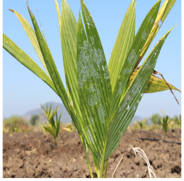
ಚಿತ್ರ 2: ರುಗೋಸ್ ಸುರುಳಿ ಸುತ್ತವ ಬಿಳಿನೋಣದ ಹಾನಿಯ ಲಕ್ಷಣಗಳು